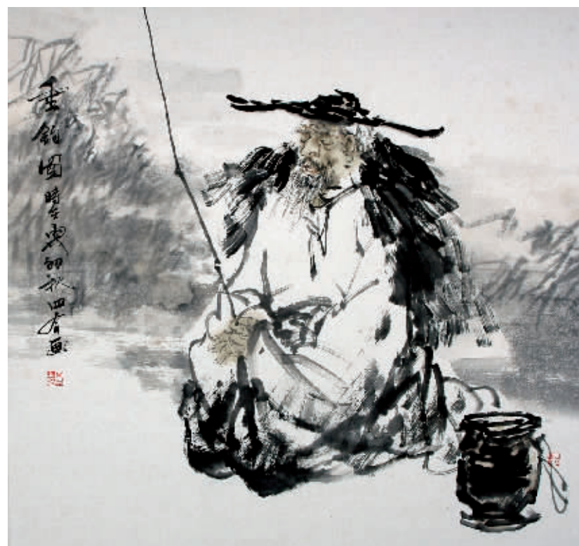
中国画·写意人物斗方

2006年作品《热血铸魂》入选美协主办的纪念红军长征70周年展览;2007年参加文化部主办的《中国青年美术家新农村采风作品》展;2008年作品《山路》入选2008年全国中国画展;作品《清冬见远山》入选2008年新人造型艺术展;作品《惠风》入选纪念改革开放三十周年全国书画邀请展;2008年8月8号在北京荣宝斋举办个人展览;2009年作品《高原情》入选庆祝新中国成立60周年全国名家书画邀请展;人物作品《山路》获甘肃省群星艺术节金奖;2010年作品《瑞雪丰年》入选全国中国画展;作品《初雪寒气清》入选红色燕赵全国山水画作品展;2011年作品《凝是银花昨夜开》获纪念辛亥革命一百周年中国书画作品展优秀奖;2013年作品《母亲》获2013年全国中国画展“优秀奖”。