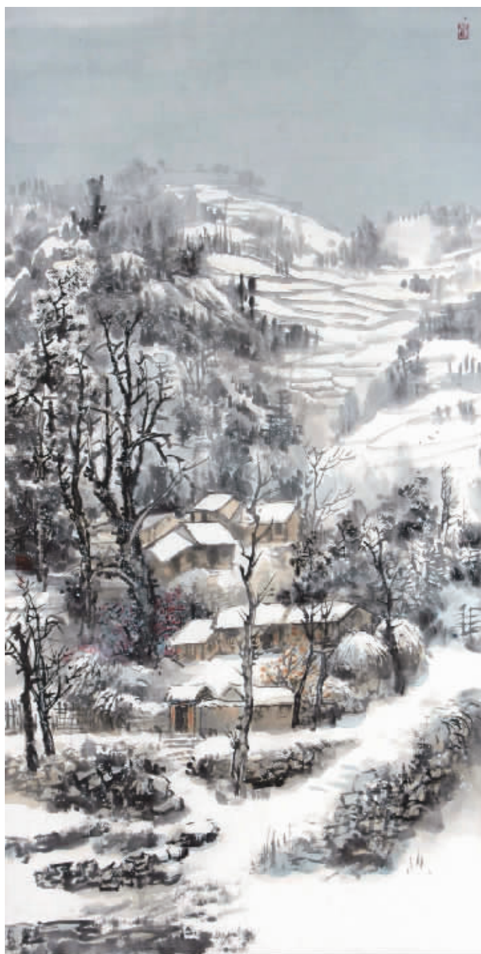
中国画·写意山水立轴

笔墨在宣纸上恣意奔放,情感在心灵里尽情挥洒,思维在视野里随意表达,他笔下的一个个人物就像是自己的婴儿一样生动的有血有肉,给人们带来了生机与活力,希望与未来。而这也是他——一个才华横溢的青年画家毕生的追求。