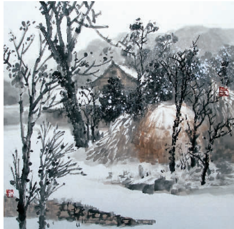
中国画·写意山水斗方

1994年中央美院著名画家姚有多、华其敏、袁武等人来西北采风写生,姚四有得以全程陪同,几位大画家均以人物画而著称,虚心求教之下使素喜人物画的姚四有获益匪浅,同时也开阔了眼界,期待着能在更高的层面提升自己,锻造技法。2005年他通过努力考入中国艺术研究院杜滋龄工作室研究生班学习。杜滋龄的画风继承了新中国成立以来国内知名大家以现实主义为主桌的绘画传统,并辅之以富有时代气息的笔墨语言。大师的言传身教,使姚四有的画技日臻成熟,其