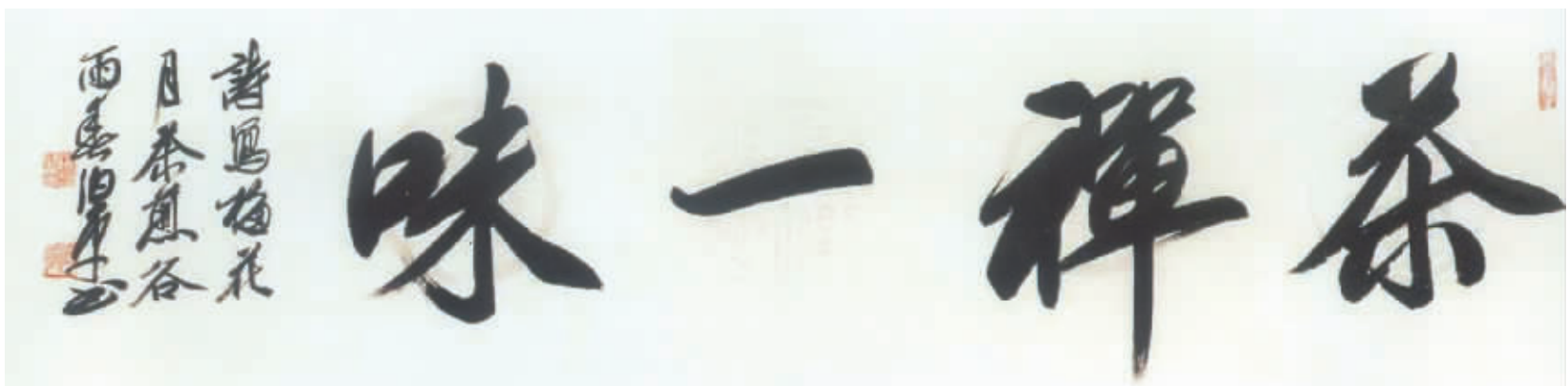
行书横幅: 茶禅一味