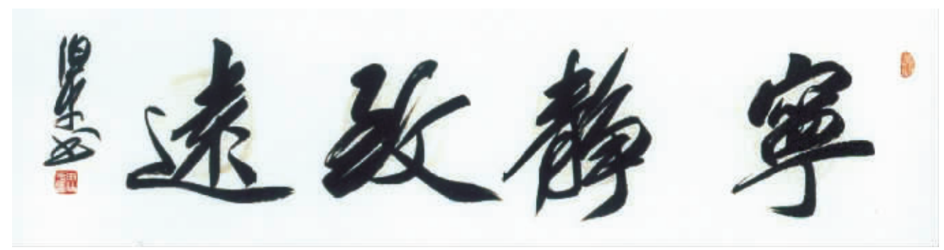
行书横幅: 宁静致远