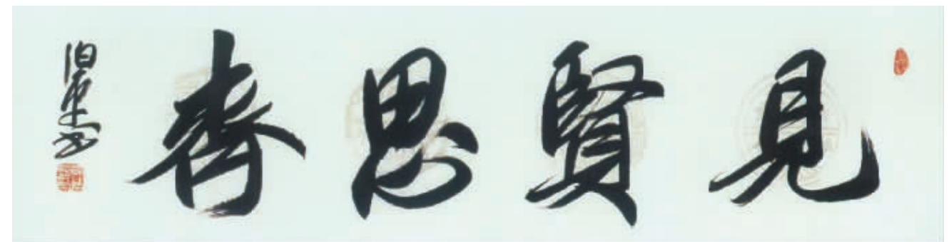
行书横幅: 见贤思齐