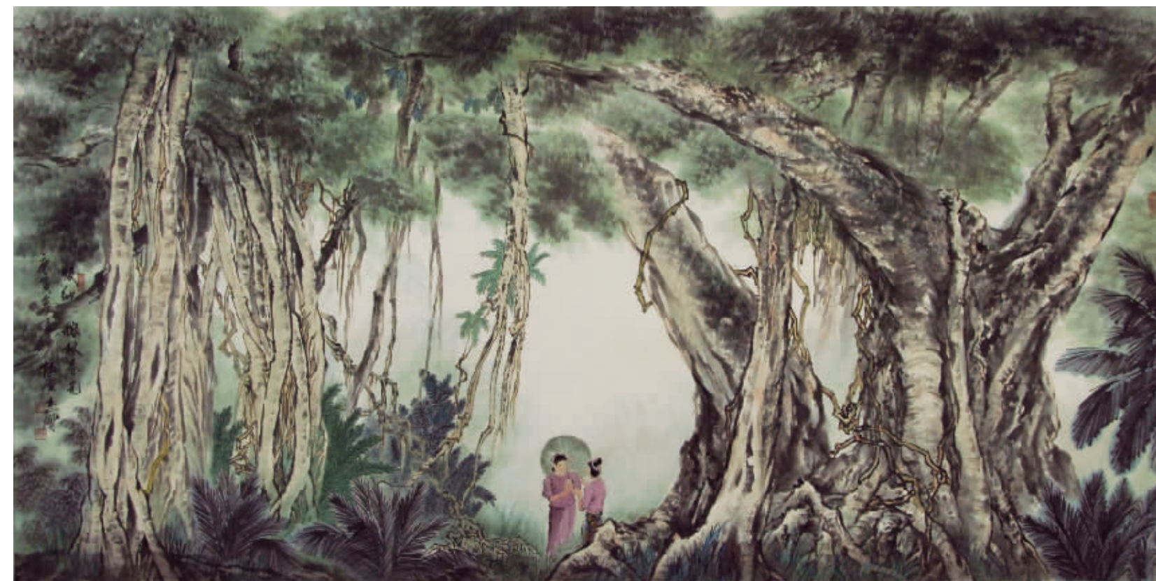
中国画《版纳榕林春光》