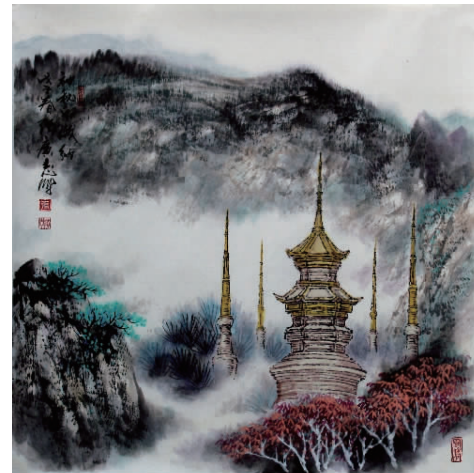
中国画《神秘的版纳》

应当承认张广志是位重视视觉语言的画家,他积极充分地调动一切绘画手段,讲究画面的精道与和谐,追求作品内在精神的充实与清新,力求深思熟虑地