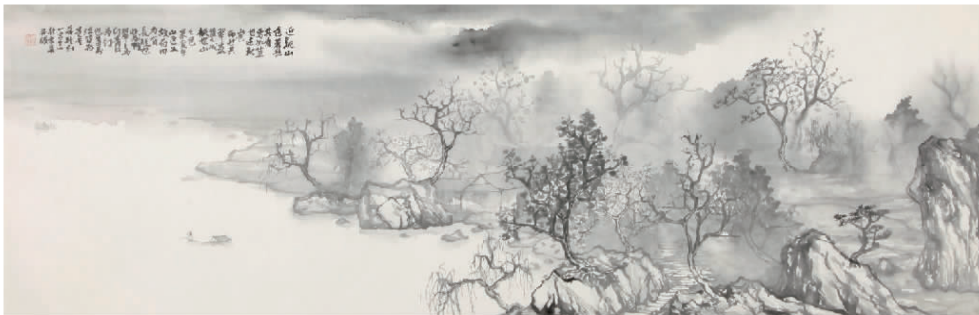
■ 中国画·雾江静韵 45cm×150cm