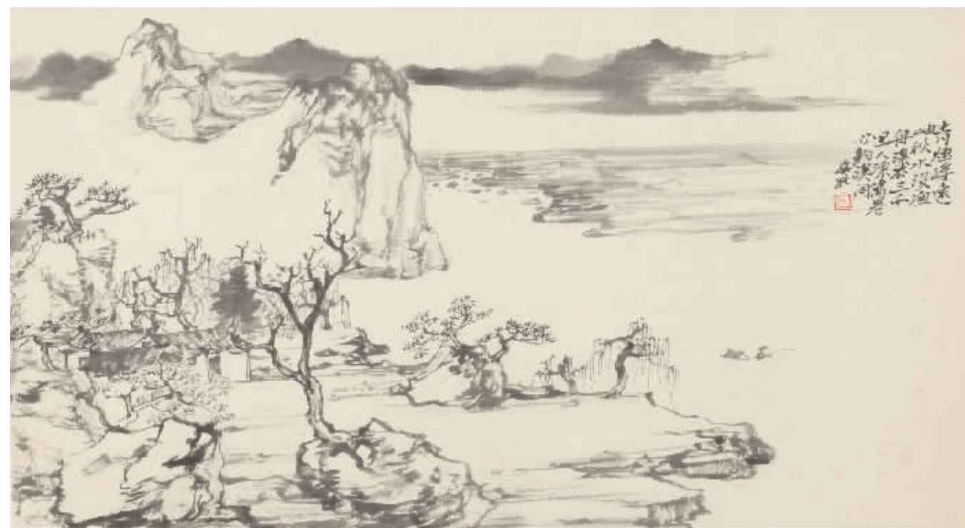
■ 中国画·秋水无边 30cm×52cm

山水画为笔墨、意境、丘壑"三美"之综合。吾以为"三美"皆须强化,然性情所致可偏于一美推向极致。故历代山水画大家有以笔墨胜者,黄宾虹是也;有以意境胜者,宋人、李可染是也;有以丘壑胜者,宋人山水是也。无论何美,人之精神与性情贯于其中,画作方有主心骨也。意境美者本以意境、境界、精神为核心,此毋庸置疑;笔墨美者亦当以精神为主导,唯呈现心迹之笔墨方为上乘笔墨,饱含精神之笔墨方能成为独立之审美对象。丘壑构造则易受自然影响,然唯与作者情感合为心象之丘壑方为有意味之丘壑,方可打动人心,而画面结构之美则与丘壑之构造同理。吾时而喜心性之心律之直接外呈,故好作一笔画,笔笔写来,笔迹与心迹同构;时而喜层层渲染,渐造佳境,并每于所造山水境界中流连