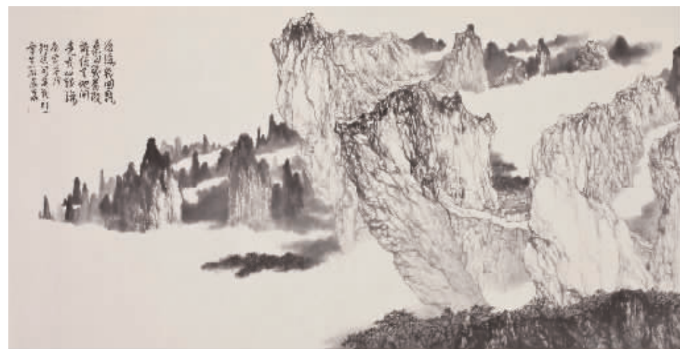
■ 中国画·山川如海 180cm×97cm