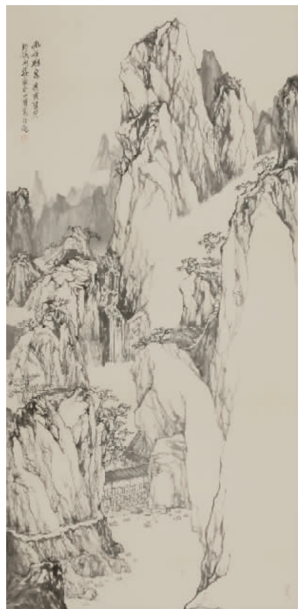
■ 中国画·幽谷听泉 136cm×68cm

出版画集《许华新画漓江》、《画道文心·许华新卷》、《中国画青年名家书系·许华新卷》《走近画家·许华新》等。编著有《中国水墨60年》《中国当代著名国画家工作室访谈录》《艺术名家在线书系》《成名之路—当代中国画名家名作解读》等。作品被中国美术馆、中国美术家协会、中国国家画院美术馆、深圳美术馆、长江艺术家美术馆等单位收藏。